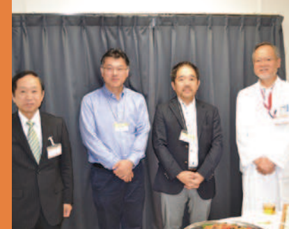
5/19(木) 東京女子医科大学八千代医療センター

今後もこのような連携懇談会を継続し、患者様が安心して急性期病院から転院していただけるよう、地域医療の一端を担っていききたいと思います。