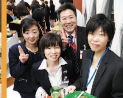
千葉みなとリハビリテーション病院と合同開催