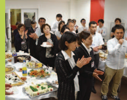
7/29(木) 成田赤十字病院