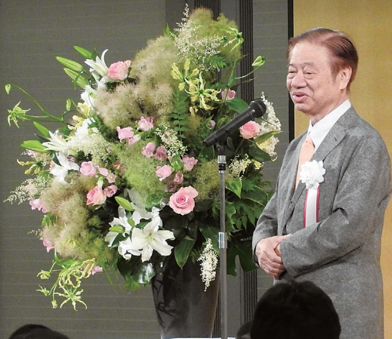
蒲池会長あいさつ