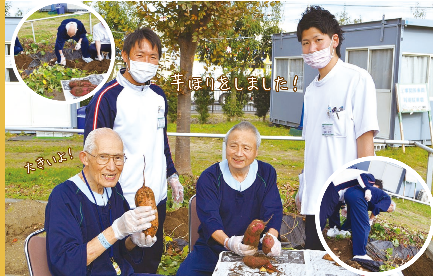
※掲載には患者様の同意をいただいております。