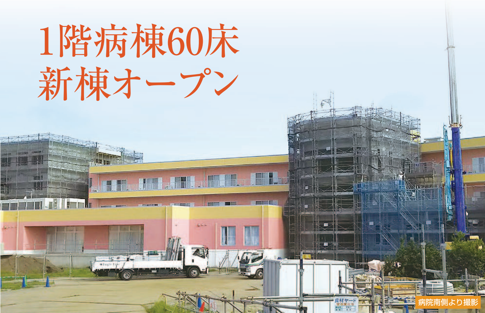
病院南側より撮影