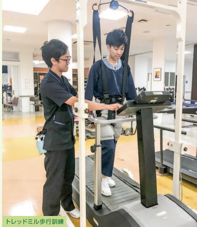
トレッドミル歩行訓練