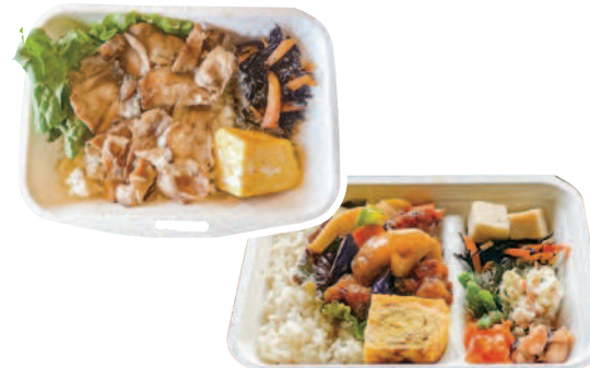
▲ テイクアウトお弁当