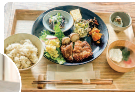
▲ 日替わりランチプレート

食材は地産地消、国産食材にこだわっています。ご飯はたくさんの栄養素を豊富に含んだ「ぬか」を残すため七分付き。毎週精米したての千葉原多古米を届けてもっています。 日替わりランチが人気です。（コーヒーセット1300円）hiyoriプレートのキーマーカー、糀の豚ご飯もおおすすめです。店内で焼いている焼き菓子やプリン、季節のスイーツも人気があります。お弁当の販売も行っています。（600円〜） hiyori 駐車場にある納屋がまもなくオープンします。古道具、雑貨、そして軽い飲食ができるほっこりできる場所としておすすです。