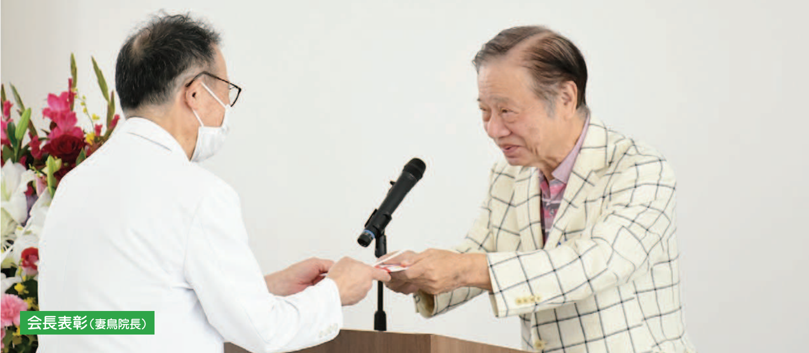
会長表彰(妻鳥院長)