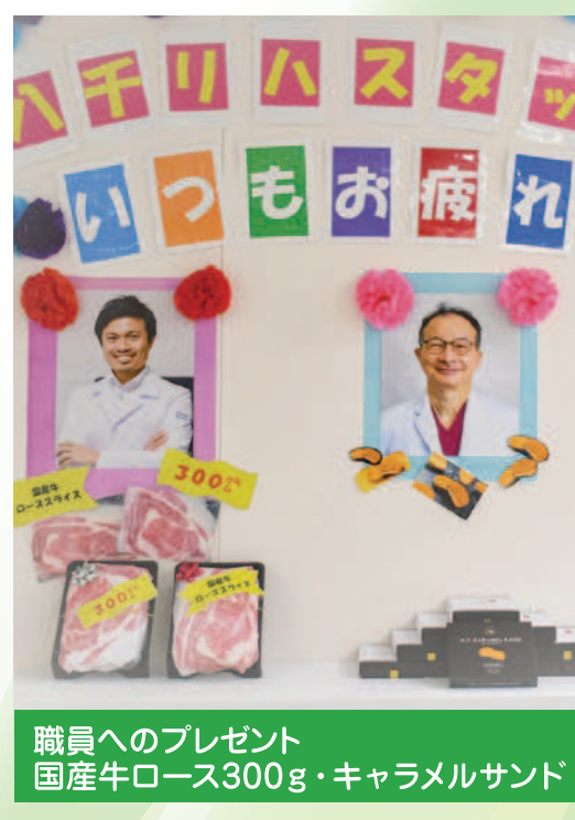
職員へのプレゼント 国産牛ロース300g・キャラメルサンド