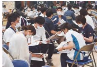
▲ 都内の職員が一堂に会し、グループワークを行いました。