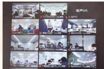
▲ 都外の職員はZoomで参加しました